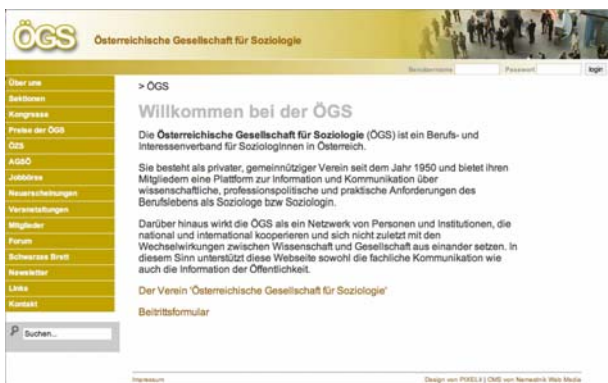
Screenshot der neuen Homepage

Auch wenn es dem einen oder anderen Mitglied beim Surfen durch das Netz schon aufgefallen sein wird, so möchte ich an dieser Stelle doch den Hinweis auf die neu gestaltete Homepage der ÖGS auf http://www.oegs.ac.at/ anbringen. Vorgenommen wurden vor allem Änderungen am Design der Homepage, im Bereich der zu Verfügung stehenden Menüpunkte sowie – weniger offensichtlich, aber für eine funktionierende Homepage von großer Bedeutung – im Content Management System (kurz: CMS).